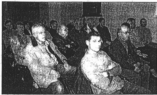
● Les riverains de la rue du Mené, venus en nombre, refusent que leur rue soit mise en sens unique.

« Le projet n'est pas définitivement arrêté. D'ailleurs, un cahier permettra de noter vos suggestions », a indiqué le maire. Il y a fort à parier que les doléances des riverains de la rue du Mené y figureront. Ils se sont élevés contre la transformation de leur voie d'accès en sens unique.